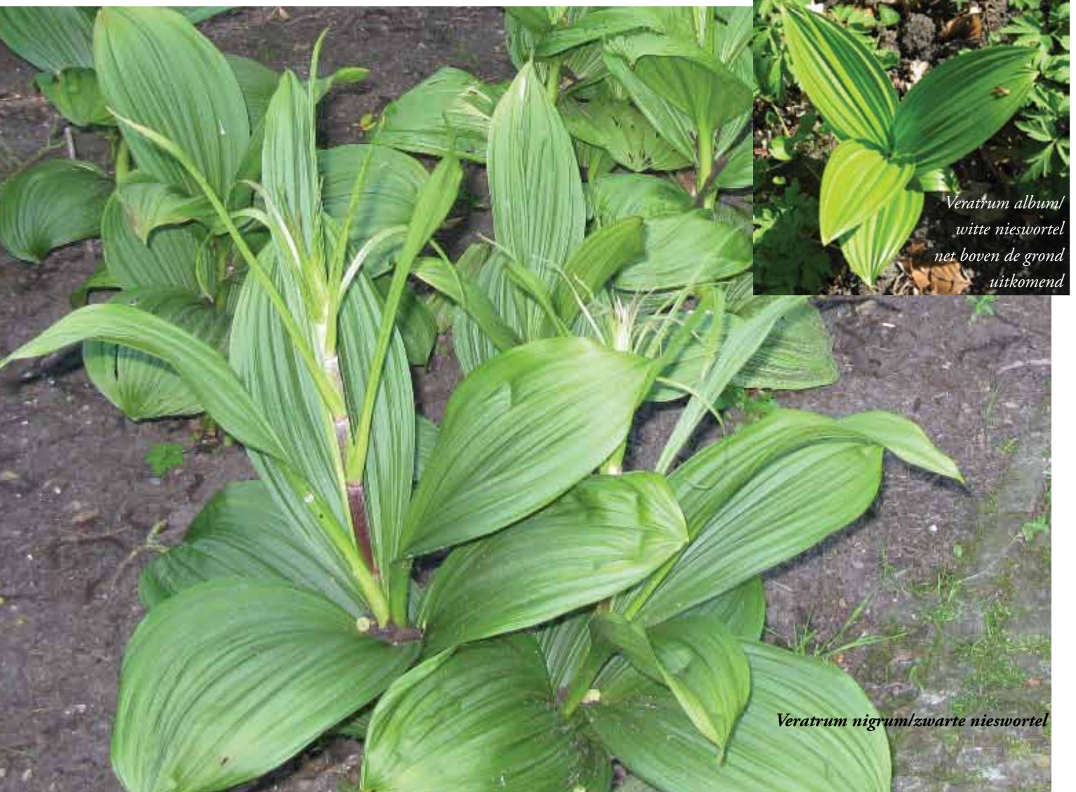
Veratrum album / witte nieswortel net boven de grond uitkomend