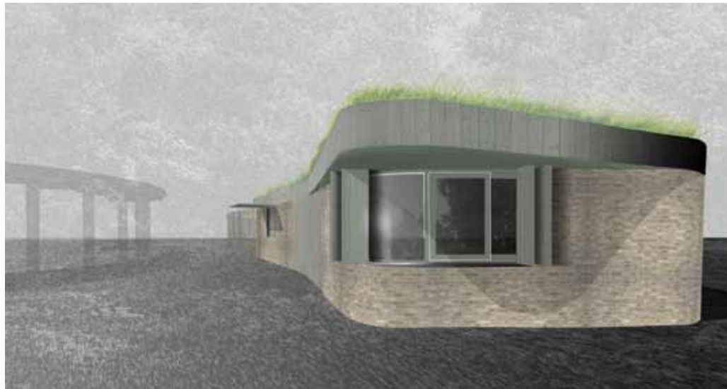
Impressies van het toekomstige parkgebouw met de toepasselijke ronde vormen

Victor Spijkers, Marc Prozman Architecten.