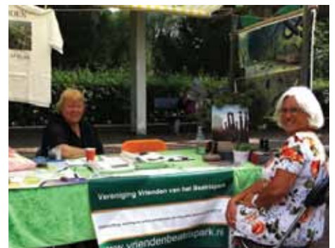
Kraam van de vereniging