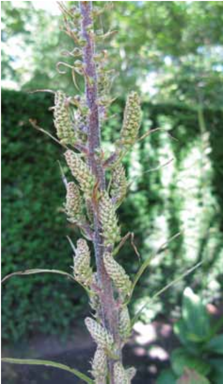
Veratrum nigrum /zwarte nieswortel in bloei

De witte en zwarte nieswortel ( Veratrum album en Veratrum nigrum ) komen van nature voor in het bergland van Noord-Scandinavië, Midden- en Zuid-Europa, Noord-Afrika en Azië. In de Artsenijhof staat de zwarte nieswortel in het middenvak, de witte in het noordvak. Het zijn vaste planten die wel anderhalve meter hoog kunnen worden. Beide soorten hebben cilindervormige wortelstokken (rizomen) waaruit jaarlijks brede, ovale, tot 30 cm lange, bladeren groeien. De bloemen vormen rijke pluimen van dichte trossen. Bij de zwarte nieswortel zijn deze bruinzwart van kleur, bij de witte nieswortel wit met groen. De bloeitijd is van juni tot augustus.