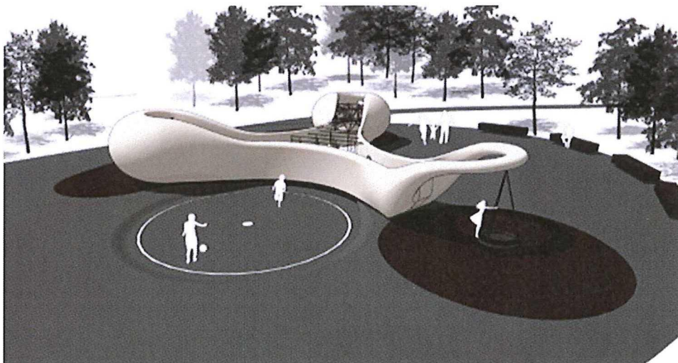
Afbeelding: speelobject Beatrixpark naar ontwerp van bureau Carve

Het speelobject is geschikt voor kinderen vanaf 5 jaar en bevat onder andere een klimgedeelte, voetbalmuur, schommel en glijbaan. Rondom het speelobject worden zitplekken gemaakt zodat het echt een verblijfsplek wordt in het park.