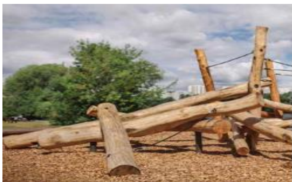
Voorbeeld houten speelobject