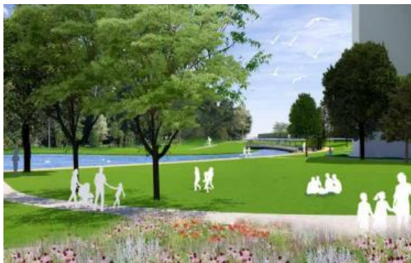
Impressie 'open kom'