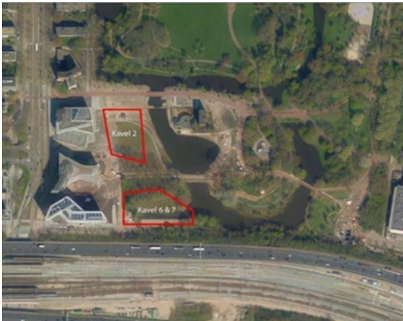
Kavel 2 (Habitat Royale) en kavel 6/7 (Park Meadows) aan het Beatrixpark

In het Zuidas-deelgebied Beethoven, gelegen tussen de Beethovenstraat, Prinses Irenestraat, het Beatrixpark en de A10, wordt momenteel volop gewerkt aan de bouw van het complex Park Meadows op kavel 6/7 (zie kaartje). Verder wordt het voormalige Convict gereed gemaakt voor de opvang van Oekraïense vluchtelingen en wordt achter de schermen de laatste hand gelegd aan het ontwerp van Habitat Royale, het geplande woongebouw op kavel 2. Met deze nieuwsbrief informeren wij u over de laatste ontwikkelingen en presenteren wij het voorlopig ontwerp van de openbare ruimte voor dit gebied.