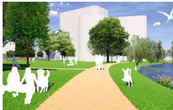
Impressie voetpad langs oever