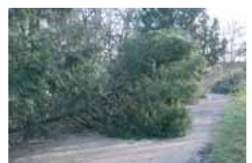
Taxus omgevallen 18 januari.