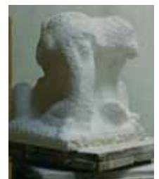
Voorstudies van het beeld.