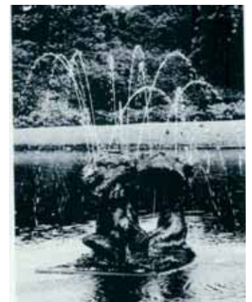
Deze waterstralen missen we dus al jaren.