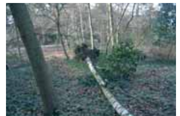
Berk in coniferenhoek 18 januari omgevallen.