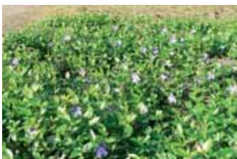
In de Artsenijhof bloeit hij - door de zachte winter? - nu al volop.