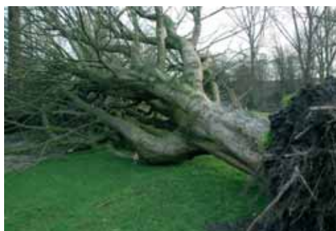
De paardenkastanje die op 11 januari is gesneuveld.