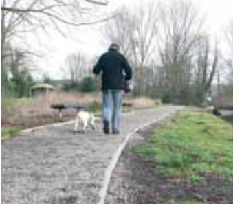
In dit deel mogen geen honden komen, omdat de beplanting erg kwetsbaar is en blijft.