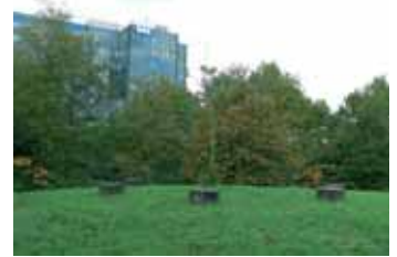
Akzo heeft zeer veel interesse getoond voor de uiterste zuidwesthoek van de Beethovenkavel, daar waar zich nu een uitkijkeuvel en de cascade bevinden.