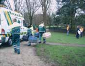
De vogels komen via de dierenbescherming, dierenartsen of particulieren, maar het merendeel komt via de dierenambulance.