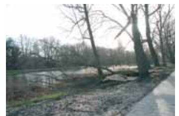
Gesneuvelde populier bij Beethovenvijver 18 januari.