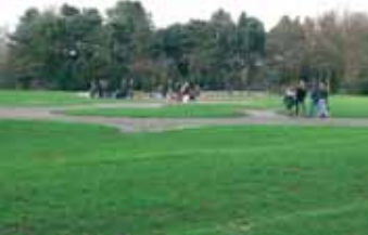
Het cirkelpad over de grote speelweide zal vervangen worden door een breed tegelpad dat licht golvend dwars over de weide loopt.

gebied. De achterzijde van de borden zal door stadsdeel, projectbureau en de vereniging gebruikt worden voor mededelingen en recente informatie. Eind april hoopt het stadsdeel/de aannemer met dit project klaar te zijn. Wij hopen dat banken, borden en prullenbakken het park zullen verfraaien en dat zij niet bezocht worden door vandalen en graffiti 'kunstenaars'.