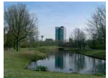
Aan de zuidzijde van de A-10 liggen de projecten Vivaldi - het bedrijventerrein waar nu o.a. het nieuwe kantoor van Ernst & Young wordt gebouwd