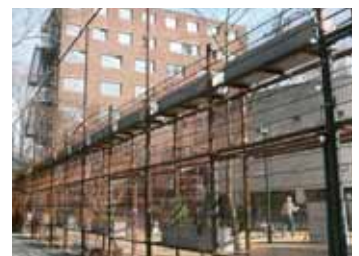
Restaurant As is inmiddels gevestigd in de kapel aan de Prinses Irenestraat 19. Op 21 april a.s. hoopt het restaurant open te gaan.