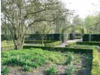
De kleine maagdenpalm staat in het noordelijk, het midden- en het zuidelijk deel van de Artsenijhof.

Deze keer bespreken we twee - in de Nederlandse natuurgebieden - beschermde plantensoorten, de grote maagdenpalm ( Vinca major ) en de kleine maagdenpalm ( Vinca minor ). Ze behoren tot de maagdenpalmfamilie ( Apocynaceae ). Oorspronkelijk zijn beide soorten afkomstig uit het Middellandse-Zeegebied. Het zijn miniheesters en prima bodembedekkers, die ook in de winter groen blijven.