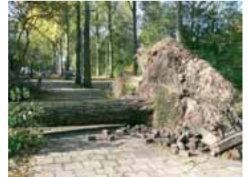
Canadese populier in de Prinses Irenestraat 1 november omgevallen.