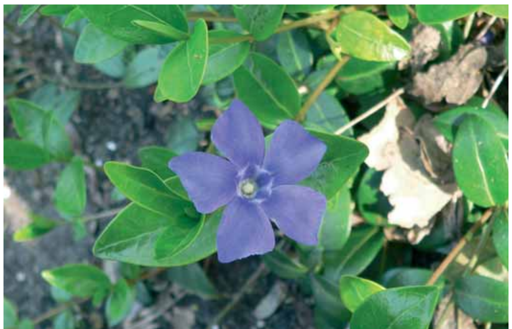
Kleine maagdenpalm de Artsenijhof