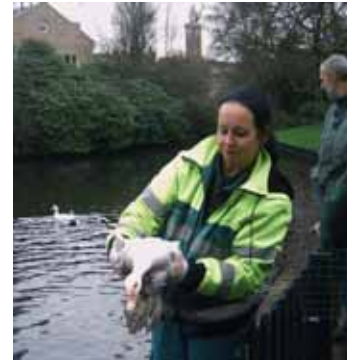
Ook zijn er 15 januari van dit jaar vanuit de vogelopvang drie ganzen, vier zwanen en negen eenden in het park uitgezet.