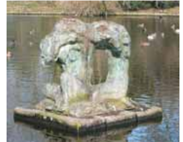
Zittende vrouwenfiguren, staat in de zogenaamde eendenvijver in de noordelijke punt van het park.