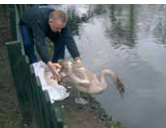
Ook voor het Beatrixpark is "De Toevlucht" belangrijk.

In Amsterdam-Zuidoost, vlak bij de woonwijk Kantershof, ligt op een eiland in de Bijlmerweide, de vogel- en egelopvang "De Toevlucht". Het eiland is een ideaal biotoop voor de opvang van niet valide vogels. Ook is er een egelopvang. In dit artikel beperken we ons tot de vogels.