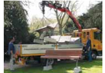
Eindelijk in de tweede week van april worden de banken in het monumentale deel van het park vervangen door de door iedereen gewenste naturel houten bank.

Bij alle grote ingangen van het park zullen informatieborden geplaatst worden, bij kinderbadje/speeltuin en Artsenijhof zullen kleinere informatieborden neergezet worden met meer specifieke informatie over dat