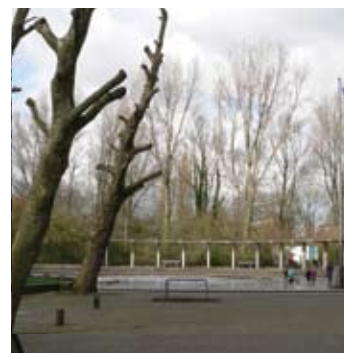
De speelplaats en het kinderbadje.