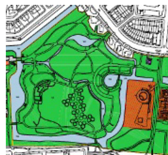
Een deel van de plankaart van het bestemmingsplan Prinses Irenebuurt e.o.

Op de kaart van het ontwerpplan was namelijk de begrenzing van het monumentale deel van het park niet ingetekend. In onze zienswijze hadden wij daarop gewezen. In het vastgestelde plan was