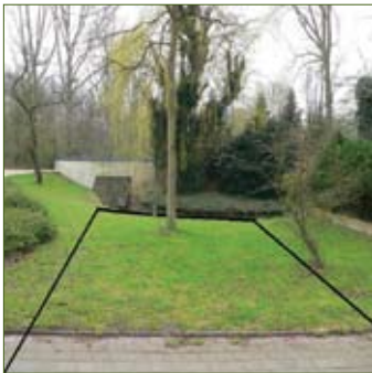
De grond van stadsdeel Oud-Zuid naast de Kapel van alle volkeren, die stadsdeel Zuideramstel tot park heeft bestemd.

deze omissie hersteld. Toen pas viel op dat de grenzen niet gelijk liepen met die van stadsdeel Oud-Zuid. Vervolgens hebben wij dit in onze bedenkingen aangevoerd.